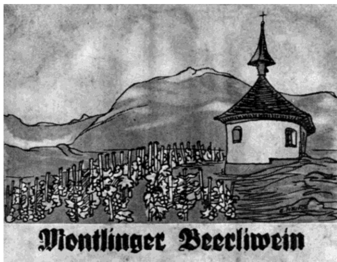
zweite Montlinger Flaschen-Etikette

Ebenfalls im Archiv erhalten ist eine weitere Etikette aus den Jahren nach 1938. Wer diese gestaltet hat, ist nicht bekannt.