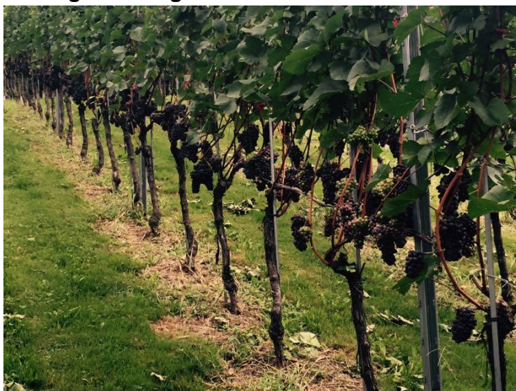
Trauben im August 2019

Nach rund 50-jähriger Abstinenz wurde durch die Ortsgemeinde Montlingen im Frühsommer 2005 erstmals wieder Wein produziert. Nämlich rund 230 7.5 dl-Flaschen Blauburgunder Pinot Noir. Damit wurde eine alte Tradition – Wein vom Montlinger Bergli – wieder Wirklichkeit.